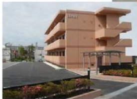
三沢市・おいらせ町で10棟となりました。

ブレインマンションFC 全国大会にて弊社加盟店ページが第3位に入賞しました！！ブレインマンションに関する情報が満載のホームページ！全国の加盟店50店以上の中から